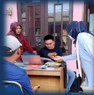
Bimbingan Teknis OSS di Desa