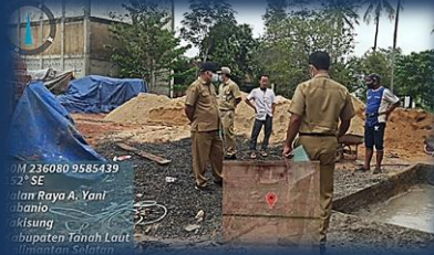
Cek Lapangan Permohonan IMB