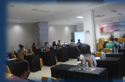
Bimbingan Teknis Pengisian LKPM