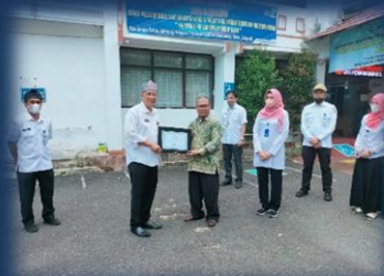
Penyerahan Penghargaan Kepada Pemohon