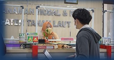
Pelayanan Perizinan Berusaha