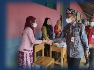
Pelayanan Keliling Perizinan Berusaha