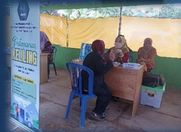
Pelayanan keliling di Desa