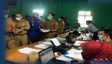
Gerei Pelayanan BPKP